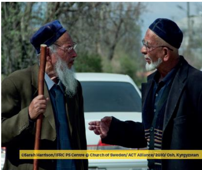
©Sarah Harrison/IFRC PS Centre © Church of Sweden/ ACT Alliance/ 2010/ Osh, Kyrgyzstan

Attività che sostengono il benessere degli adulti durante l'isolamento/quarantena domestica: