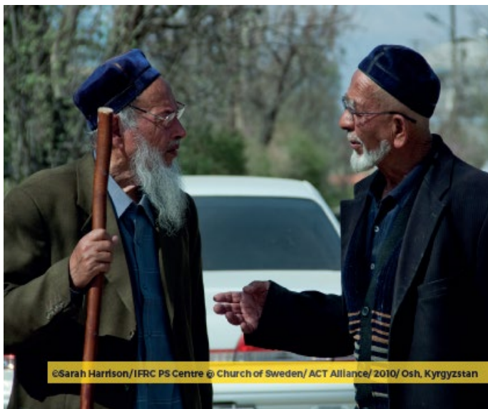
©Sarah Harrison/IFRC PS Centre © Church of Sweden/ ACT Alliance/ 2010/ Osh, Kyrgyzstan

Atividades que apoiarão o bem-estar dos adultos durante o isolamento / quarentena em casa: