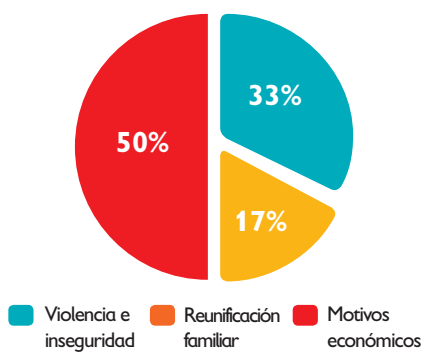
Causas indicadas de migración por niños, niñas y adolescentes detenidos en Tapachula, México

Fuente: Elaboración propia. Datos extraídos del informe « Arrancado de raíz », ACNUR.