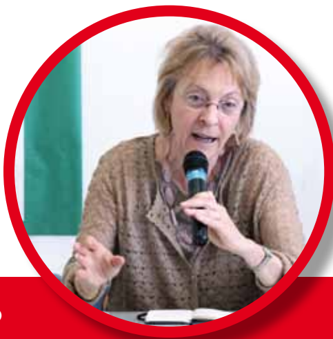
Soledad Puértolas. Escritora y miembro de la Real Academia Española

años estuve enferma en cama y me leían cuentos todos los días, ahí me di cuenta de que yo también quería contar historias. Sentí que la imaginación era importantísima”, explicó la escritora. Soledad Puértolas respondió a las preguntas y curiosidades de alumnos de todos los cursos y les aconsejó que busquen “eso que sólo tenéis vosotros, porque cada uno es especial, y aprovecha-dlo para escribir” .