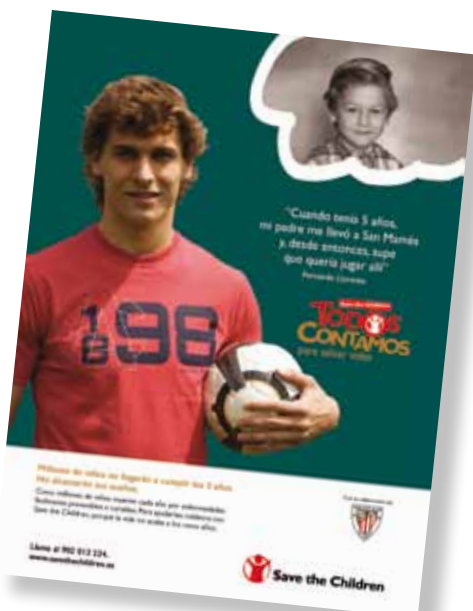
Fernando Llorente. Jugador de fútbol, Campeón del Mundo en Sudáfrica 2010

lista es consciente de que hay muchos niños y niñas en el mundo que tal vez nunca puedan cumplir sus sueños. Por eso, ha querido ir más allá en su implicación con la situación de los niños y las niñas en el mundo y se ha convertido en embajador de Save the Children.